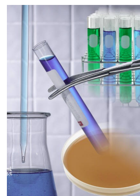
Пояснительная подпись под рисунком.

Бросая себе новые вызовы – конкурсы, выступления, проекты, – учитель становится для учеников образцом для подражания. Педагог, у которого есть стремление заявить о себе, о своей профессиональной деятельности педагогической общественности, публично старается создать свой профессиональный имидж. Конкурсы педагогического мастерства играют важную роль в решении этой задачи. Уже в самом участии педагога в конкурсе педагогического мастерства можно увидеть значительное количество преимуществ, таких как повышение своего социального статуса, обучение на опыте коллег, реализация творческого потенциала, участие в исследовательской деятельности, раз-